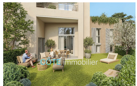
Programme neuf - Convention milancip - MLS Côte d'Azur

Côte Immobilier - 25, avenue Thiers - 06600 Antibes - Juan les Pins Tél. +33(0)4 97 23 96 23 - www.cote-immobilier.fr - info@cote-immobilier.fr