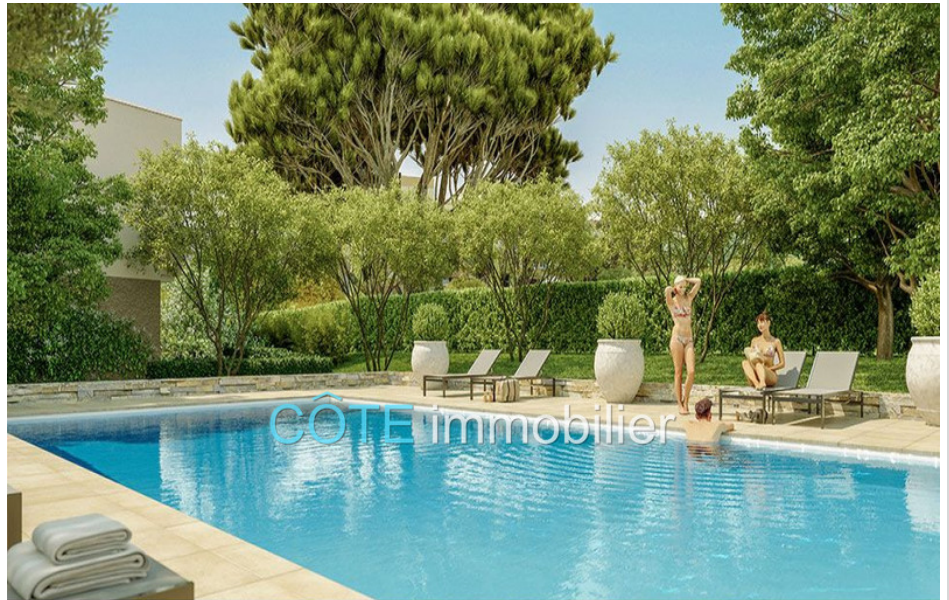
Programme neuf - Convention milancip - MLS Côte d'Azur